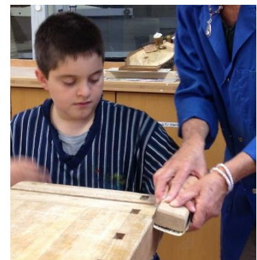
helfen und selber steuern, individuell angepasst