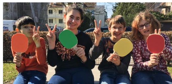
Alle sind stolz, dass die Aufgabe gelingen ist