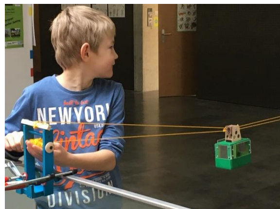
Mit Stolz das entstandene Produkt ausprobieren, Spielideen entwickeln