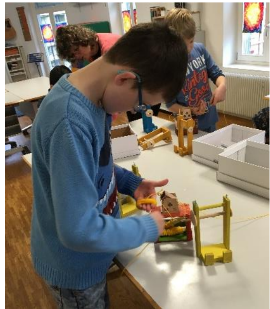
Handhabung und Funktion selber steuern lernen