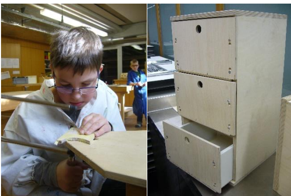
Eine Gestaltungsidee für die Schubladenfront des selbst gebauten Möbels entwerfen und umsetzen