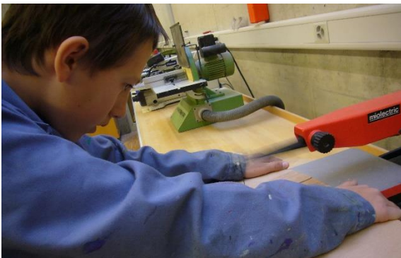
Konzentration, Sorgfalt, Gefahrenbewusstsein