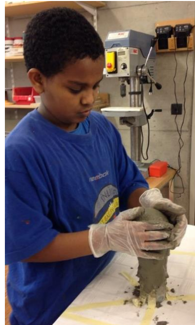
kreativ sein, selber gestalten