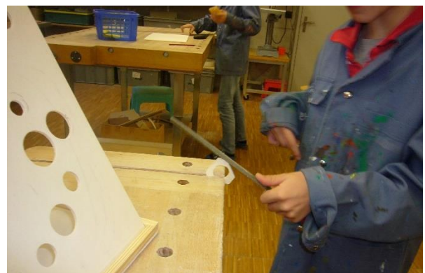
Werkzeuge korrekt handhaben lernen, Ausdauer und Sorgfalt lernen